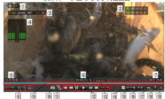
GUIイメージ図 クリップ再生画面